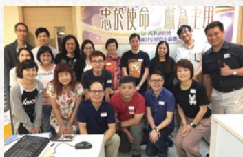
在新辦公室首次舉行義工團契聚會