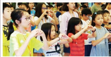
唱營歌《小小敬拜者》