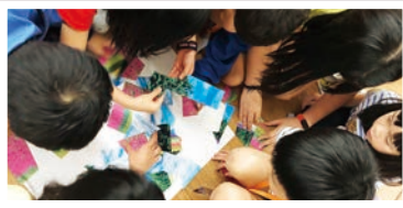
齊齊拼圖：拼出燦爛人生