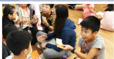
活動：你願為神捨棄甚麼？