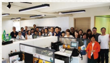
基督教零售業協會成員來訪