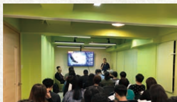
首次借予港九培靈研經大會，作書攤簡報會場地。