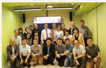
在新辦公室首次舉行年議會

新辦公室標誌着讀經會發展邁向新的一頁，事工呈現新的氣象和面貌，同工亦逐步適應新的事奉生活。新辦公室帶給我們新鮮感，亦為讀經會帶來許多第一次，我們沒有忘記這些「第一次」，都印證了神的恩典和眾教會及聖徒的愛心。