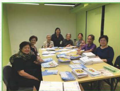
首次義工寄發通訊服事