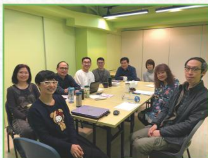
首次舉行的同工會議

新辦公室標誌着讀經會發展邁向新的一頁，事工呈現新的氣象和面貌，同工亦逐步適應新的事奉生活。新辦公室帶給我們新鮮感，亦為讀經會帶來許多第一次，我們沒有忘記這些「第一次」，都印證了神的恩典和眾教會和聖徒的愛心。