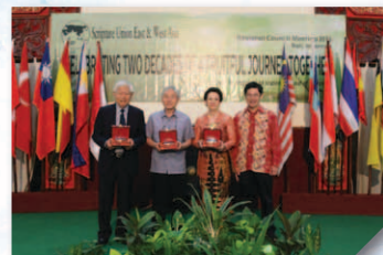
會議尾聲，向過去各屆議會主席致謝