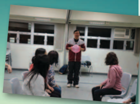
從生活中也可以尋找到好遊戲!