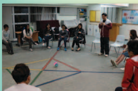
善用道具，帶出不一樣的效果。好遊戲百玩不厭