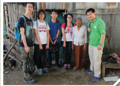
這位老婆婆的生活環境雖然不好，但傾談中她常常感謝神。

我最深刻的行程是探訪居住在垃圾山的家庭。因為這座垃圾山真是名副其實，到處充斥着垃圾和一些小昆蟲，很骯髒，卻有許多人居住在其中，尤其是以老人家最多，而且大多是獨居或與孫兒一起。與他們傾談得知，原來老人家的子女大多在外地工作，將小孩交給父母照顧，他們只是偶爾回來看看。雖然生活得很艱苦，老人家的臉上卻掛着笑容，並且因為能夠信主，以及主所賜予許多的恩惠而感恩。在這裏，帶給我許多反思，也讓我更加珍惜現時所擁有的一切。