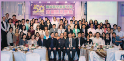
這麼難得的機會，當然來個大合照。