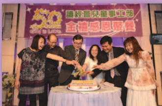
開開心心切蛋糕，齊來慶祝CSSM五十歲的生日。