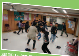
學習以遊戲帶出真理