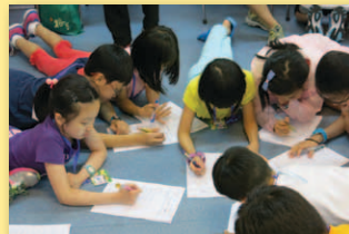
一同填寫性格測試問卷。

營會於8月3-5日（主日至二）假香港青年協會西貢戶外訓練營舉行，目的是幫助兒童成為有使命感與責任感的小領袖，學習在教會中承擔事奉。有來自8間教會共65位兒童及導師參與，透過設計遊戲、討論分享、性格測試、事奉實習、發揮恩賜天才表演等活動，去幫助兒童發掘恩賜，並明白事奉必須有的態度與心志。