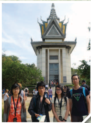
參觀萬人塚，了解柬埔寨歷史上慘痛的一頁。