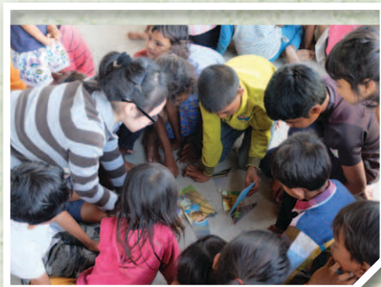
帶領兒童從活動中學習真理，他們都玩得很開心。

令我最印象深刻的活動是探訪當地兒童，我們為了這次探訪做了不少準備工夫，只希望能帶給這些兒童歡笑和喜樂。當我們到達時，一個情景深深地印在我的腦海中——那些小朋友整齊地排成了兩行，安靜地等待我們，而且這個行動是沒有人教過，純粹是他們希望用這方式來歡迎探訪他們的人，這行動令我刻骨銘心。那天，雖然我們只是跟他們玩了兩個簡單的小遊戲，但他們也玩得不亦樂乎，及後的手工製作也十分認真投入，令我感到十分滿足，並再一次明白到快樂不需要很複雜才能得到。