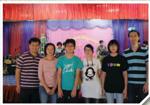
我們參與Holy Church的主日崇拜，並在崇拜中獻唱Sun Pilot運動主題曲《伴你高飛》，亦參與該堂的青少年聖誕活動。

內容：探訪教會、孤兒院、垃圾山居民、認識柬埔寨文化、服事當地兒童、參與青少年聚會、靈修等