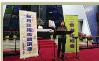
每月讀經專題講座