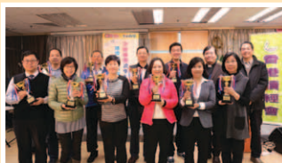
奪得「團體大獎」的領獎者與頒獎嘉賓合照

2013-14年度共有133個單位，當中超過7,800位信徒參與本運動。本年度的運動已於去年9月底圓滿結束，並已於12月7日舉行了運動頒獎禮，其中有545位參加者完成了全年的讀經進度，11位信徒獲單位負責人推選獲得「傑出個人大獎」，經計算成績後，十個單位奪得「團體大獎」，一個單位獲本會推選奪得「推動大獎」。