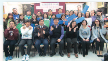
證書課程聯合畢業典禮

兒童工作者證書課程：21人（全年－4科） 4人（選科） 短期訓練課程：春季－44人（2科） 秋季－73人（2科）