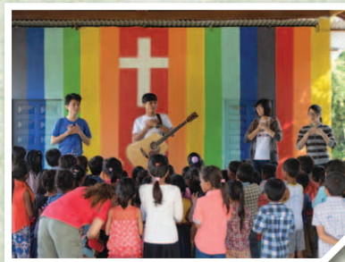
與柬埔寨的弟兄一同帶領兒童唱詩讚美神，還配合動作呢！