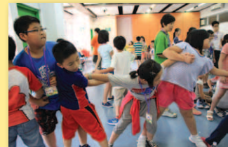
玩遊戲，學習互助合作精神。