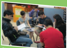
學習帶領青少年尋索聖經真理

青少年導師要有熱誠，也要認清召命和有合適的裝備，這個有系統的一年制課程，讓弟兄姊妹在心態、靈命和技巧上有所更新，作更美好的服事。本年度共有12位參加者，當中8位順利畢業。