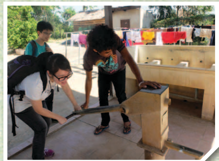
了解孤兒院的生活情況。你猜猜我們正在做甚麼？