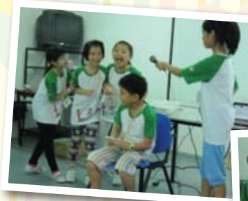
你扮媽咪，我係你個仔。