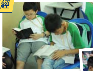
生命成長、改變都係靠晒佢！