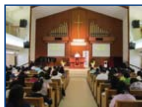
合辦單位香港靈糧堂借出寬敞舒適的禮堂，讓信徒能安靜學習聖經真理。