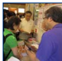
聚會期間，參加者把握時間於本會書攤購買讀經材料。