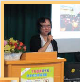
淑儀作出任內最後一次事工報告。