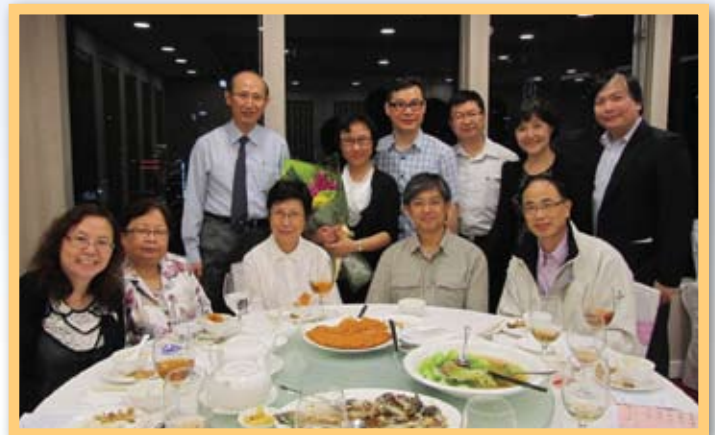
淑儀與眾理事合照