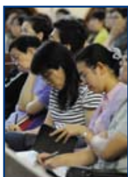
營前講座的參加者都十分專心學道。