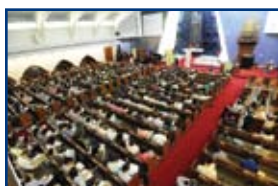
數百位信徒出席了營前講座。