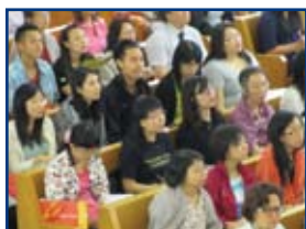
參加者由青少年至長者都有，可見神的話均能在不同年齡的人身上發揮作用。