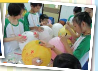
齊齊創作燈籠，為主發光！