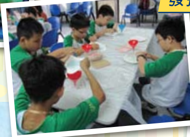
製作沙杯，做得專心又開心！