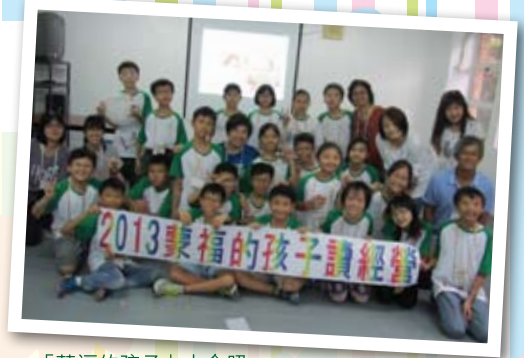
「蒙福的孩子」大合照

營會在黃昏結束，孩子們對今次營會的回應是：開心、好玩、有趣、精彩、內容豐富、有所學習、希望明年可參加3日2夜的活動。