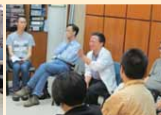
作者踴躍發言，交流意見