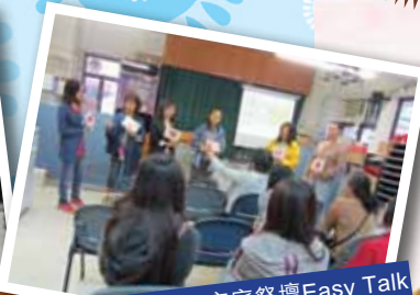
家家有本「當唸」的經—家庭祭壇Easy Talk