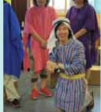
大家手舞足蹈，全情投入敬拜主！