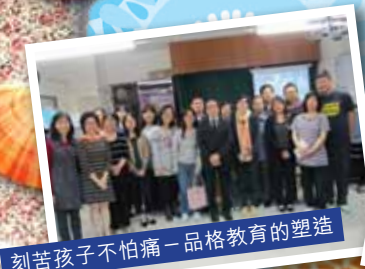
刻苦孩子不怕痛—品格教育的塑造