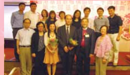
本會同工和理事前來慶賀。